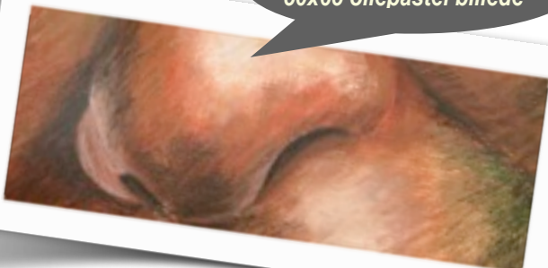
Kvindenæse, udsnit af 50x65 oliepastel billede