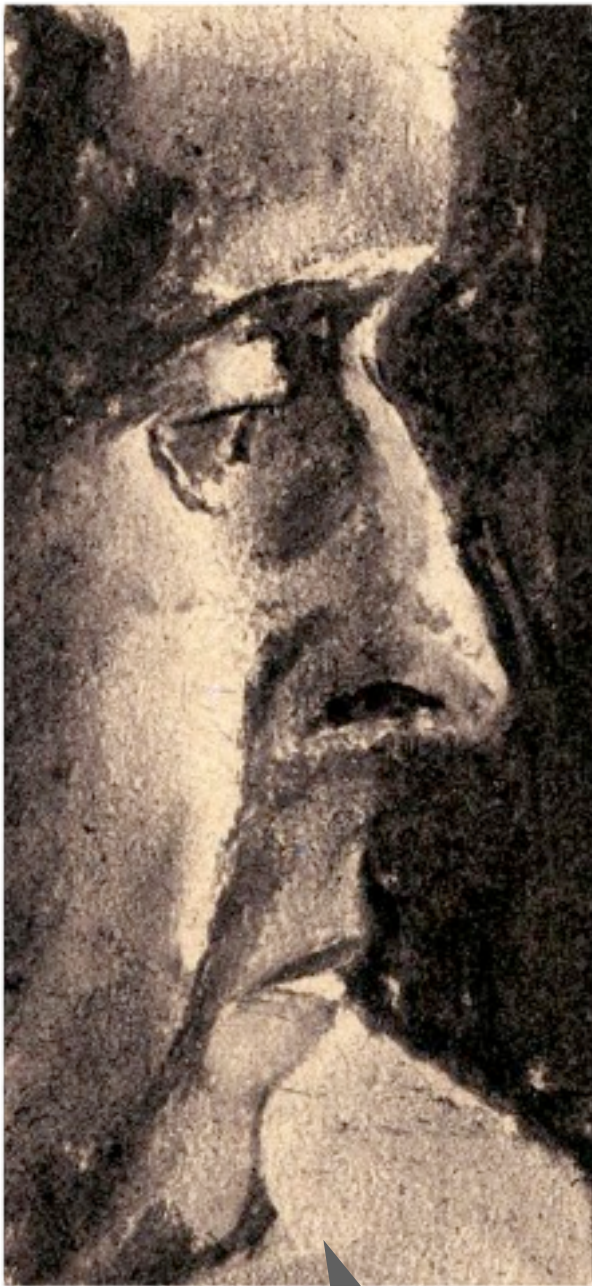
Portræt croquis, kul på karduspapir, ca. naturlig størrelse