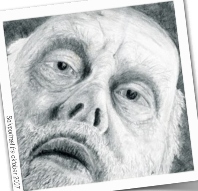
Selvportræt fra oktober 2007